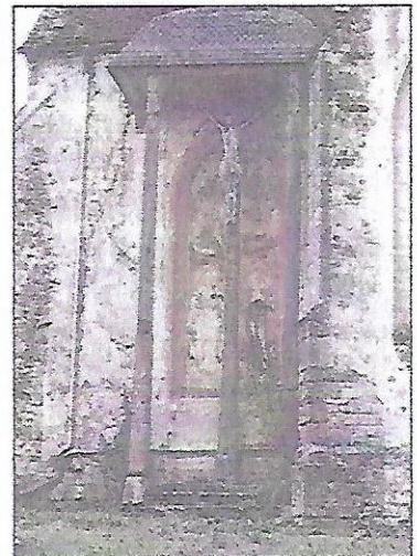
Le calvaire avait bien besoin d'un coup de jeune.